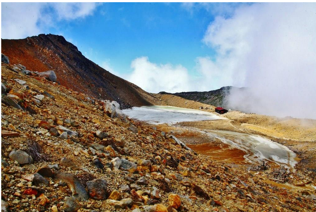
御嶽山二ノ池