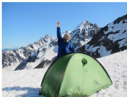
天狗の科尔にテント

上高地(横尾)から槍沢をグリーンバンド下まで詰めて天狗原に登り、天狗の科尔でビバーク。