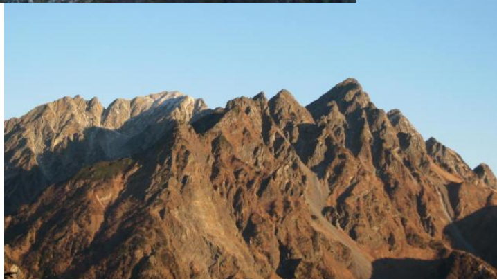
槍ヶ岳からの前穂高岳と徳本峠からの明神岳